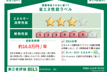
省エネ性能ラベル