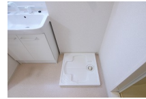
その他部屋・スペース