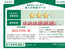
省エネ性能ラベル