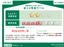
省エネ性能ラベル