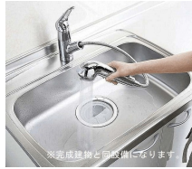
※完成建物と同設備になります。