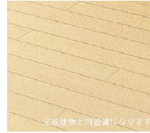
※完成建物と同設備になります。