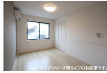
その他部屋・スペース