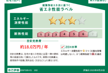
省エネ性能ラベル